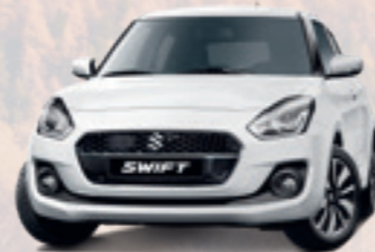
NEW SWIFT HYBRID