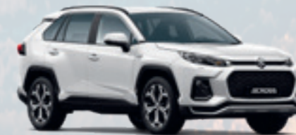
NEW ACROSS PLUG-IN-HYBRID