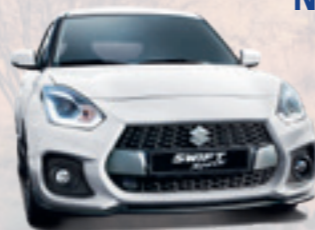
NEW SWIFT SPORT HYBRID