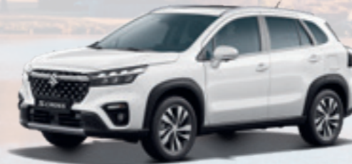
NEW S-CROSS VOLLHYBRID