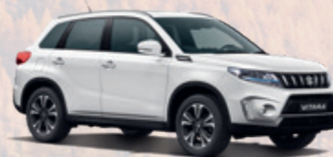
NEW VITARA VOLLHYBRID