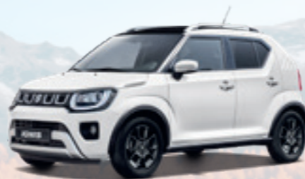
NEW IGNIS HYBRID