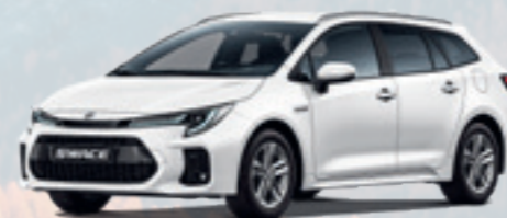
NEW SWACE VOLLHYBRID